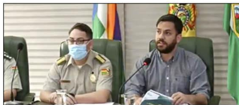
INFORME. El ministro de Gobierno, Eduardo del Castillo, habló de la captura del sujeto.