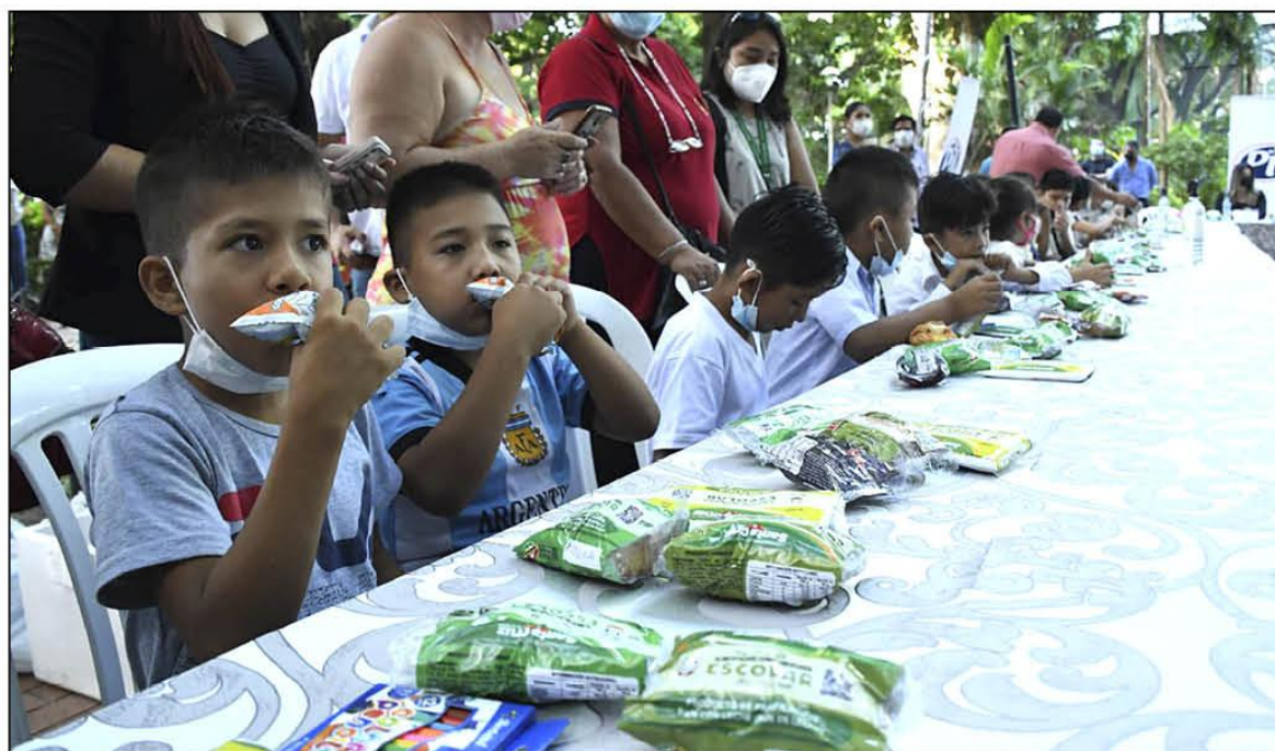
INVERSIÓN . La entrega de la alimentaria complementaria en Santa Cruz de la Sierra cuesta Bs 65 millones.

Con este aporte de nutrientes y vitaminas a la población infantil, el municipio prevé mejorar el rendimiento intelectual de los educandos de Santa Cruz de la Sierra. La innovación tecnológica también será utilizada