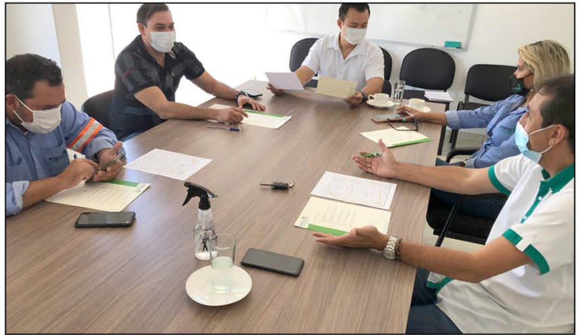
COORDINACIÓN. Emacruz, la ACCC y Los Picarazos, trabajando en conjunto para la limpieza en todas las actividades carnavalescas en la ciudad.

SANTA CRUZ. Para el Corso cruceño en el Cambódromo desplegarán maquinaria y personal de trabajo para realizar el barrido, desempapelado y desglose de árboles para que el lugar se encuentre en buenas condiciones, así mismo realizarán la desinfección para garantizar la bioseguridad..