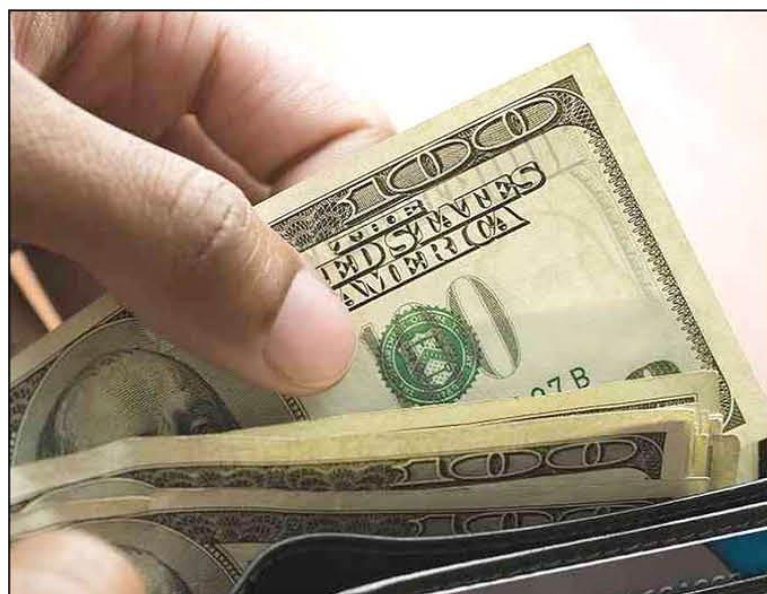
REPORTE. Bolivia presentó una entrada neta de capitales por $us 258 millones por Inversión Directa.

En ese contexto, Bolivia logró indicadores de cobertura de Reservas Internacionales Netas (RIN) que se encuentran por encima de los parámetros referenciales a nivel internacional, según datos del BCB.