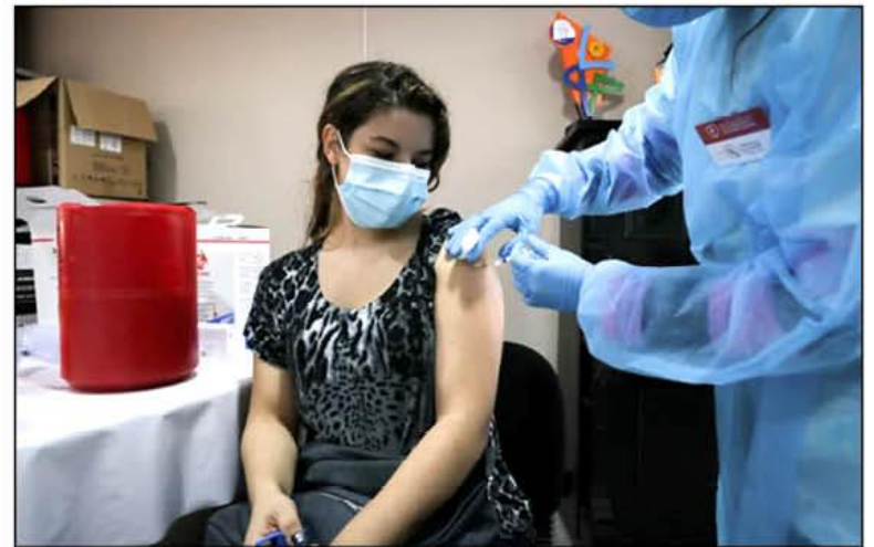
VACUNACIÓN. Uruguay priorizará la cuarta dosis a personas con comorbilidades e inmunodeprimidas.

Con respecto a las personas inmunodeprimidas, el Ministerio de Salud Pública aclaró que dentro de este grupo se comprende a los receptores "de trasplante de órganos sólidos y precursores hematopoyéticos, inmunodeficiencias primarias, personas en hemodiálisis y diálisis peritoneal, personas viviendo con VIH con recuento CD4+ menor a 250 células /ul, pacientes oncológicos y hematooncológicos en tratamien-