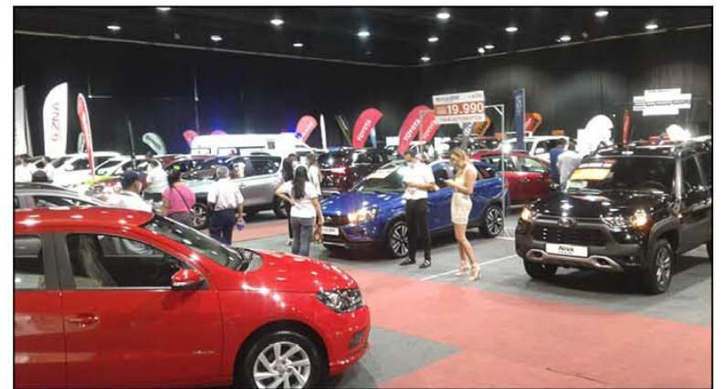
ACCESO. La entrada para la Expoauto costará Bs 20 para mayores y Bs 10 para menores de 12 años.

La figura varía un poco si el solicitante de crédito tiene entre 18 y 34 años. En este caso el banco financia el 90%