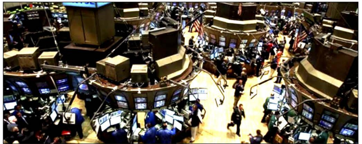
DESPLOME. Una fuerte caída se registró ayer en Wall Street por el conflicto entre Rusia y Ucrania.

semana en las tensiones geopolíticas, que se sumaron a las preocupaciones sobre los planes de endurecimiento monetario de la Reserva Federal para este año. Las pérdidas de ayer ponen al Dow en camino a terminar la semana en territorio negativo.