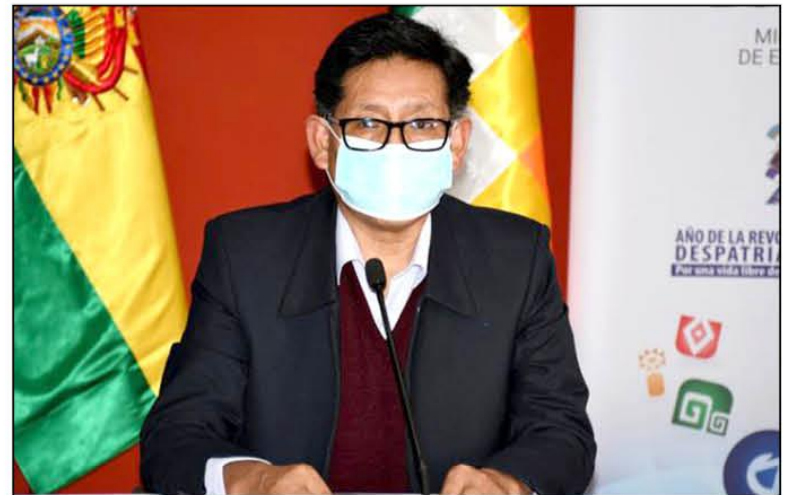
AUTORIDAD. El ministro de Educación, Edgar Pary.

“Vamos a pedir el reporte de número de vacunados por edad, eso va a permitir medir cuántos estudiantes tenemos vacunados con primera o segunda dosis”, acotó.