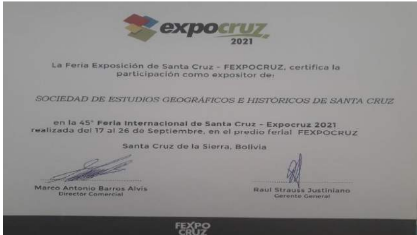
Finalizando la Feria, se nos entregó el certificado de participación como expositores a la Sociedad de Estudios Geográficos e Históricos de Santa Cruz.