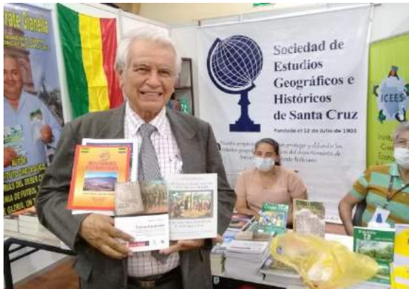
Comprando libros en el Stand de la SEGH-SCZ