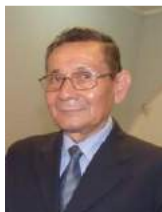
Gral. Herland Vhiestrox H.