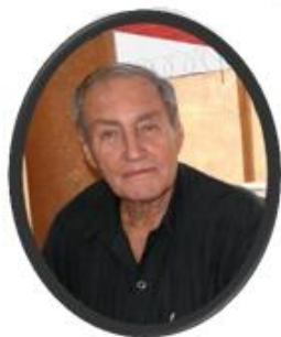
Socio Vitalicio Cap.Av. Eugenio Verde-Ramo Costas Resolución N°4/2021