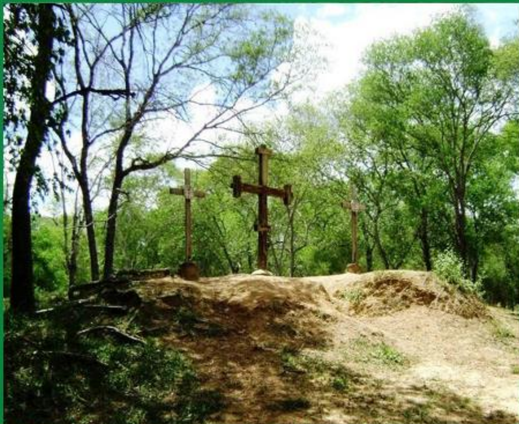
San José de Chiquitos, Sitio fundacional de Santa Cruz de la Sierra

Apuntes sobre la historia, geografía y geopolítica regional